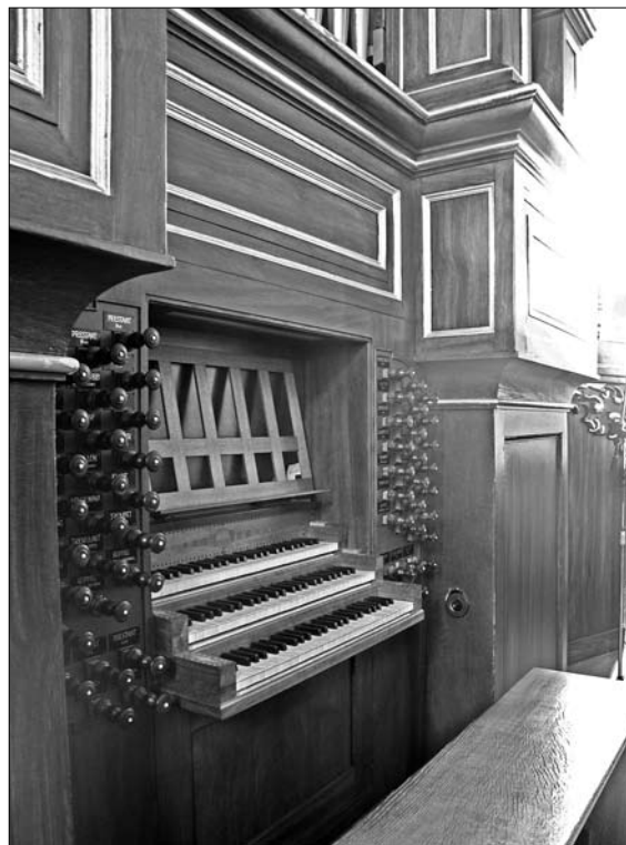
Claviatuur van het Zutphense Bader-orgel

en Orgel Raad en de Commissie Orgelzaken (PKN) en is op dit moment voorzitter van het College van Orgeladviseurs Nederland. Daarnaast is hij actief als docent en dirigent van kamerkoor Akkoord (Hilversum) en treedt hij op als solist, begeleider en in ensembleverband.