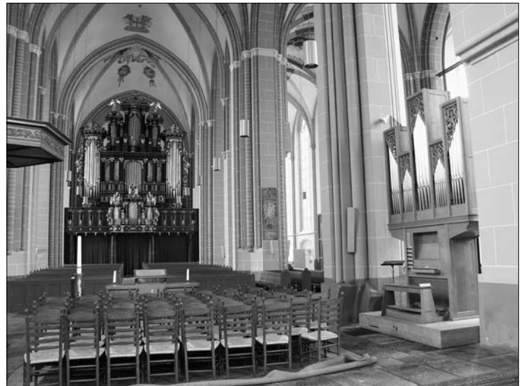
Het Bader- en het Ahrend-orgel in de Walburgiskerk te Zutphen

B = Bader 1643 B+ = Bader 1643, register was als zodanig in Baderdispositie niet aanwezig, pijpwerk afkomstig uit verdwenen registers T = Timpe 1814 R = Reil 1996