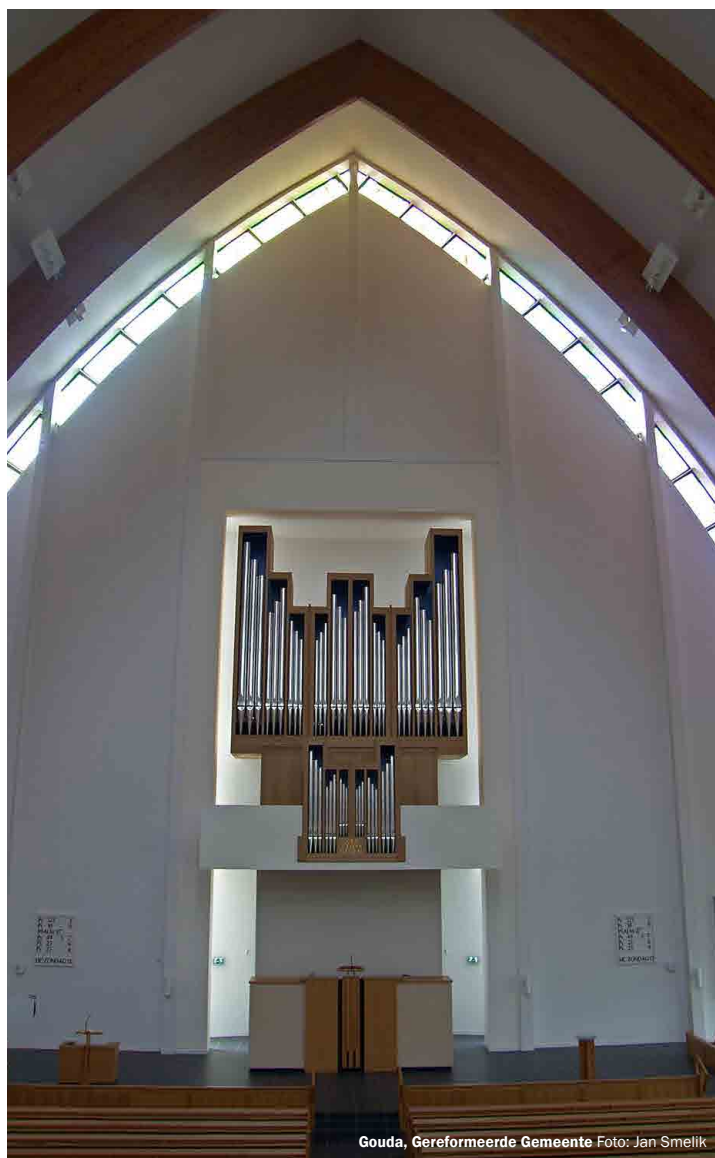
Gouda, Gereformeerde Gemeente

Dit jaar willen wij onze eerste studiedag en jaarvergadering houden in de woonkamer van onze voorzitter. Het is hier behaaglijk warm en dat is van de meeste kerken op dit moment niet te zeggen. Wij zijn hier welkom op 9 februari, het adres: J.J. Allanstraat 386 in Westzaan. Wij beginnen om 14.00 uur, na de ontvangst met koffie of thee, met het vergadergedeelte. De agenda hiervan is als volgt: