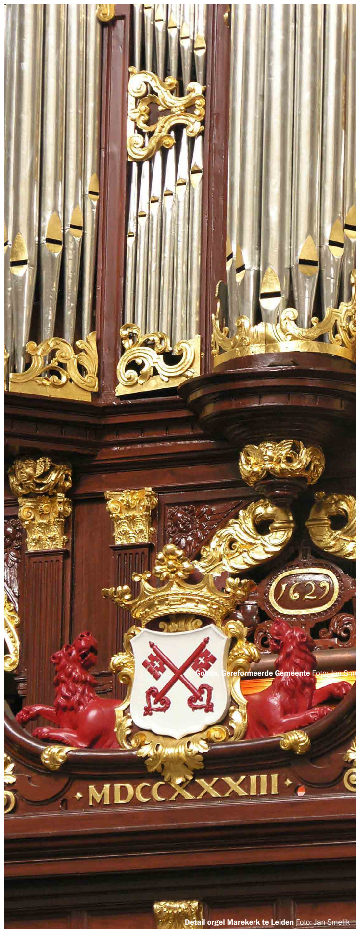
Detail orgel Marekerk te Leiden