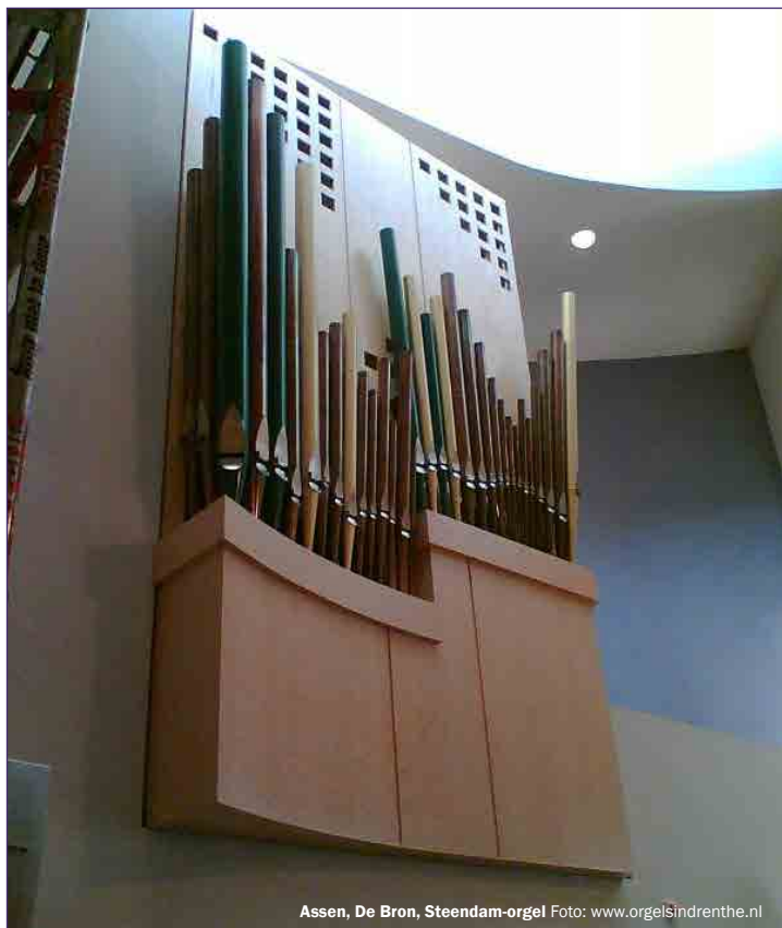
Assen, De Bron, Steendam-orgel