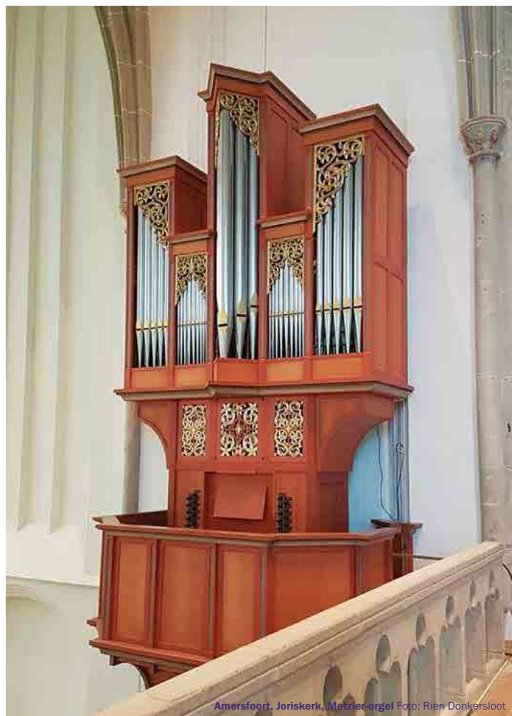
Amersfoort, Joriskerk, Metzler-orgel

Het concert begint om 20.00 uur. Toegang: 8 euro (tot 21 jaar: gratis).