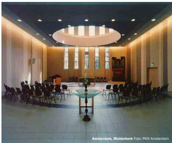
Amsterdam, Muiderkerk

Ook kunnen jongeren meedoen in de categorie 'duospel'. Daarvoor gelden dezelfde regels: maximaal twee stukken van in totaal hooguit acht minuten. Jongeren kunnen zich opgeven via de site van de Orgelkring Assen ( www.orgelkringassen.nl ), waarop ook meer informatie is te vinden. De deelnemers worden in een van de twee leeftijdsgroepen