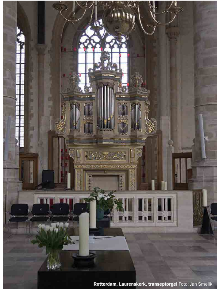
Rotterdam, Laurenskerk, transeptorgel

Meer informatie vindt u op www.rotterdamorgelstad.nl