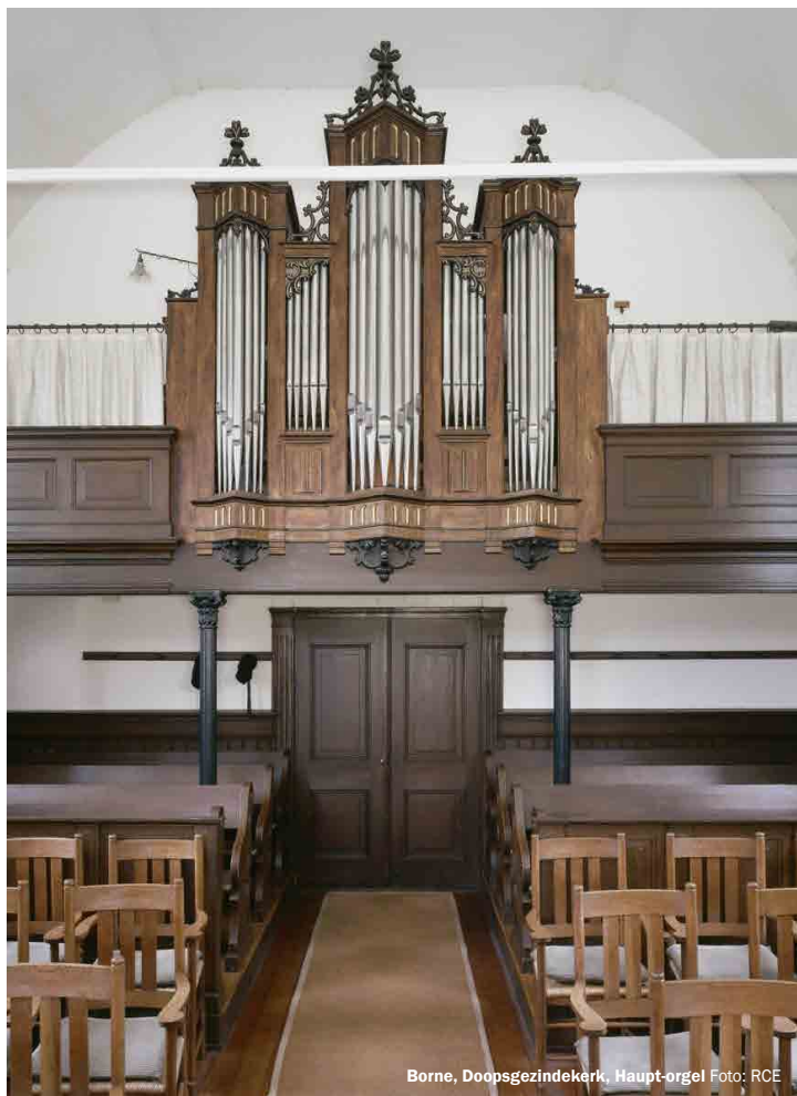
Borne, Doopsgezindekerk, Haupt-orgel