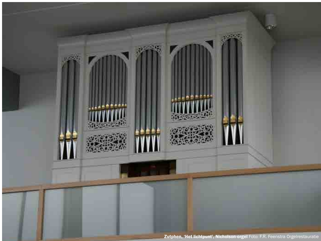
Zutphen, 'Het lichtpunt', Nicholson-orgel Foto: F.R. Feenstra Orgelrestauratie

Vooraf aanmelden per e-mail is zeer gewenst, zodat we weten hoeveel deelnemers we kunnen verwachten. Ook niet KVOK-leden