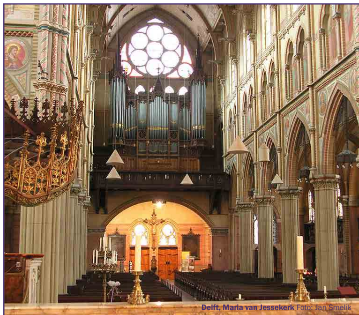
Delft, Maria van Jessekerk